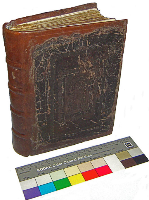
Kirchenbuch Hahnbach, Band 15

Ein Ortsfamilienbuch kann und soll eine Ortschronik nicht ersetzen. Für die Betrachtung der geschichtlichen Entwicklung der Region können diverse Arbeiten 3 , die Hahnbach behandeln, herangezogen werden.