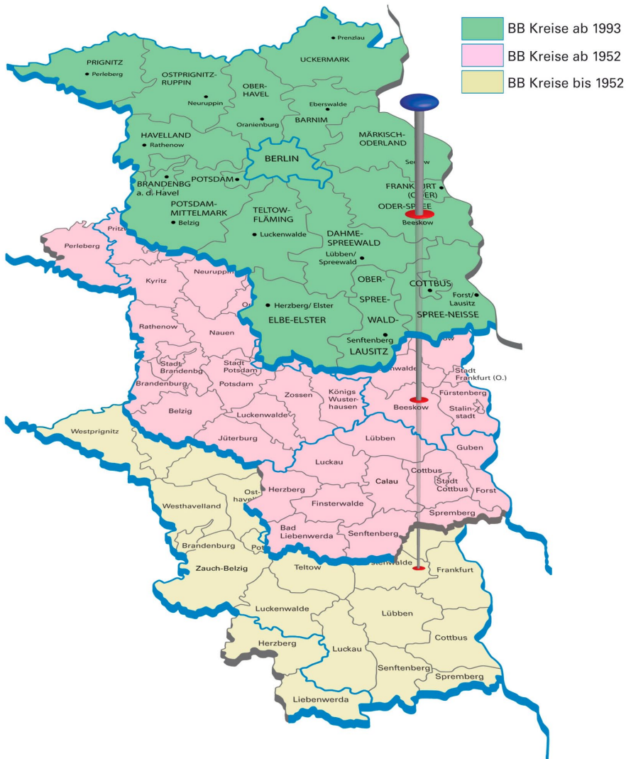
Abb. 3: Veränderung der Kreisstrukturen im Land Brandenburg. Für jede Gemeinde lässt sich in GOV die Zugehörigkeit zu den Landkreisen zeitlich ablesen.

Gemeinden waren, die Zuordnung zu den Landkreisen, die bis zum 25. Juli 1952 bestanden und die durch das „Gesetz über die weitere Demokratisierung des Aufbaus und der Arbeitsweise der staatlichen Organe im Lande Brandenburg“ [9] aufgelöst