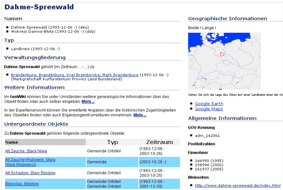
Abb. 2: Inhalt des GOV anhand der Benutzeransicht des Landkreises Dahme-Spreewald

In dieser Ansicht findet man den Namen des gesuchten Objektes, geographische und administrative Informationen, wie